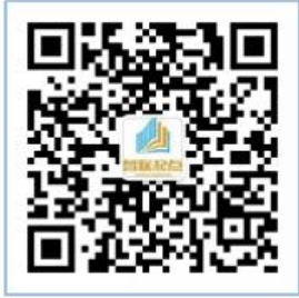
关注“起点考试” 微信公众号